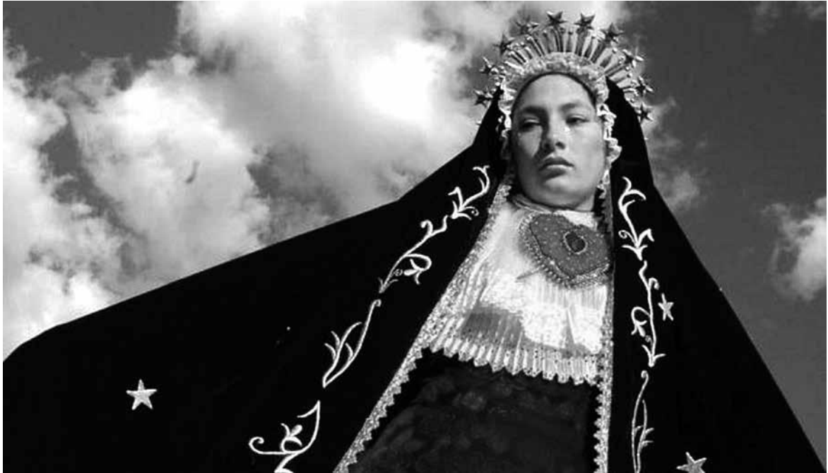
Fotograma de Madeinusa, de Claudia Llosa, 2005.

En el cine y la fotografía se usa frecuentemente la posición de la cámara (o el ángulo de visión) como un medio expresivo. ¿Cuál es el nombre del ángulo usado en la siguiente fotografía?